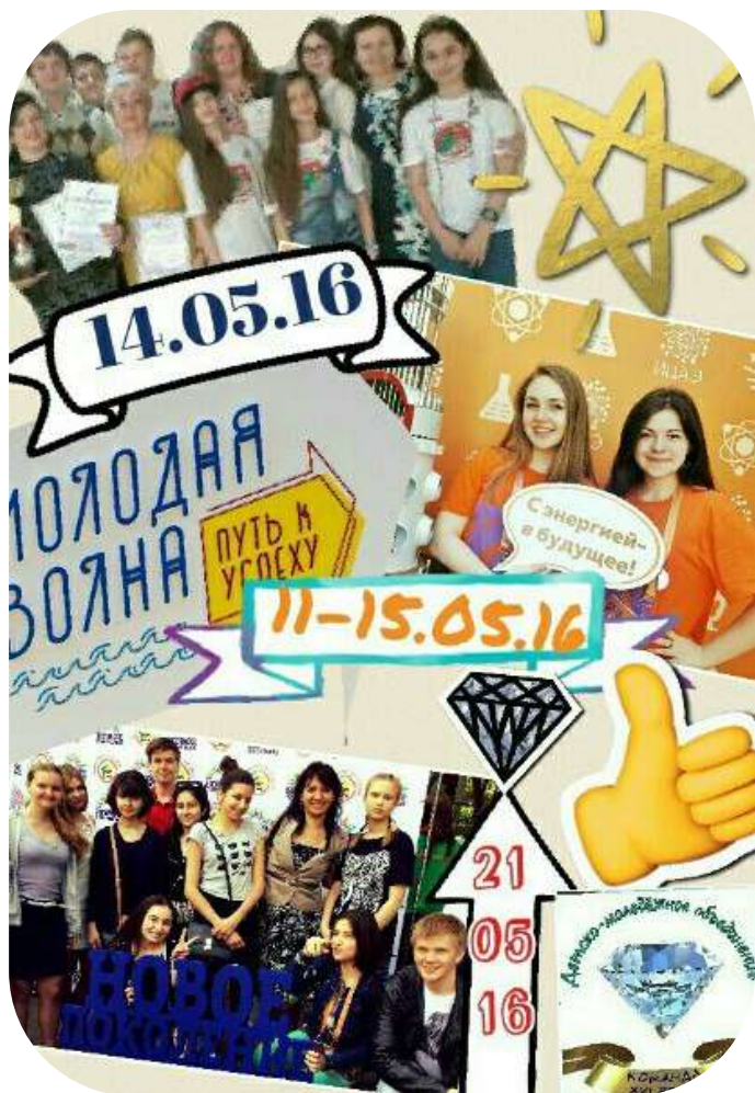
Автор работы: Елизавета Мохина, тренер ДМОО «Команда XXI века»